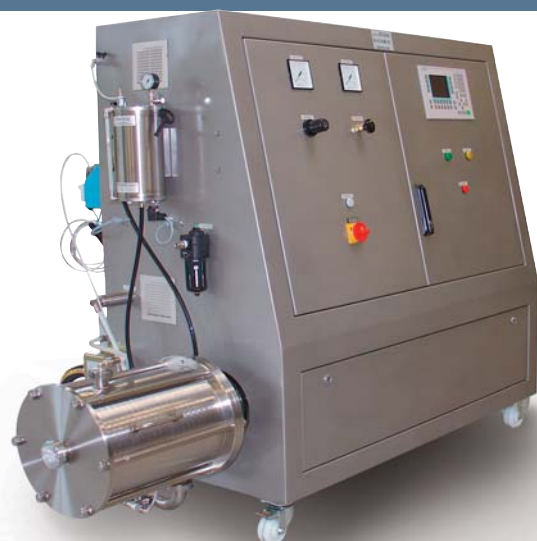
SICOMIX für die Vlies- und Textilindustrie